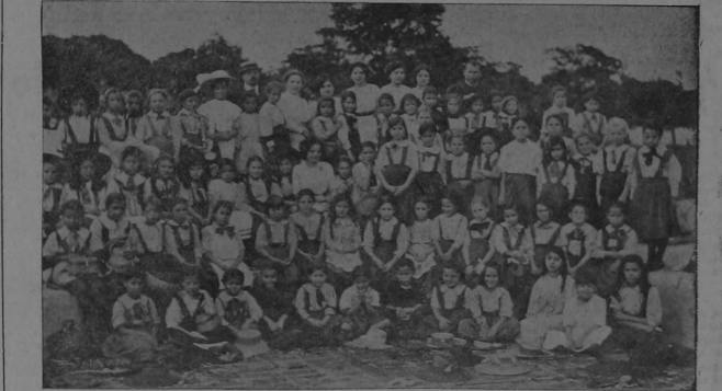
Alumnas y profesores del Colegio Superior de Señoritas Vista tomada durante un paseo al Campo de Ensayos del Departamento de Agricultura en Guadalupe